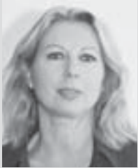
Prof. Pasqualina Perrig-Chiello Präsidentin der Leitungsgruppe des NFP 52

Ziel des NFP 52 ist es, über die gegenwärtigen und zu erwartenden Lebensverhältnisse sowie Bedürfnisse von Kindern und Jugendlichen in der Schweiz neue Einsichten zu gewinnen. Besonderes Augenmerk wird intergenerationellen Aspekten geschenkt, da in der Schweiz diesbezüglich nicht nur erhebliche Forschungslücken, sondern auch eklatante Mängel in Bezug auf eine nationale Sozialberichterstattung bestehen. Die Bearbeitung dieser komplexen Zielsetzung im Rahmen von 29 Forschungsprojekten zeigt eine reiche Ausbeute sowohl in wissenschaftlicher wie praktischer Hinsicht. Es ist eindrücklich feststellen zu dürfen, dass es den meisten Projektverantwortlichen zum einen gelungen ist, ihre Forschungsergebnisse in nationalen und internationalen wissenschaftlichen Zeitschriften sowie Monographien zu publizieren. Zum anderen haben sie das generierte Wissen an Tagungen und Symposien verschiedenen wissenschaftlichen und praxisorientierten Zielgruppen präsentiert. Die Rückmeldungen aus Wissenschaft und Praxis sind ermutigend ( www.nfp52.ch ).